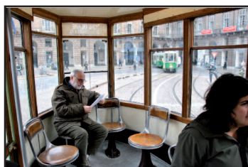
Andrinta a un-a dle viture